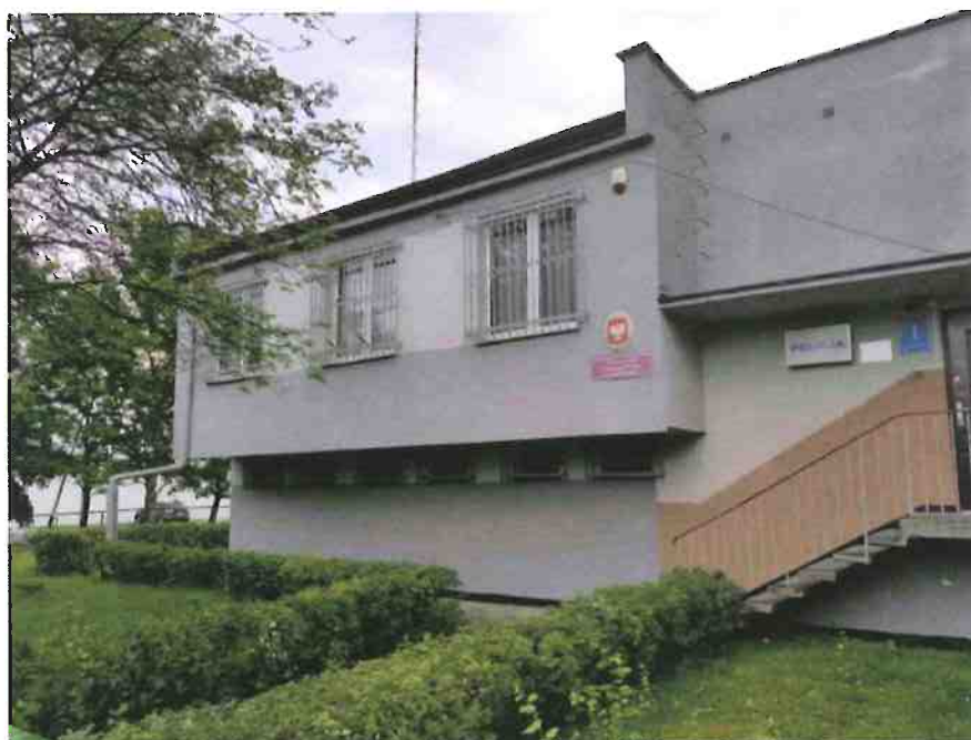
Fot. 1. Ogólny widok budynku.

W czasie badań ww. budynku nie stwierdzono potencjalnych miejsc rozrodczych dla nietoperzy, nie stwierdzono również samych zwierząt.