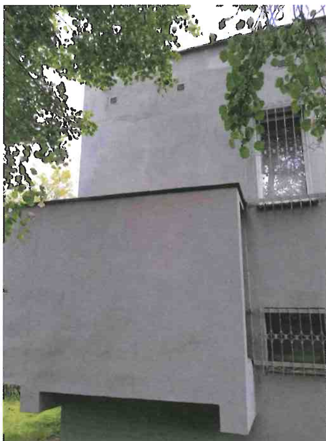
Fot. 5. Wykończenie dachu bez widocznych szczelin i otworów.