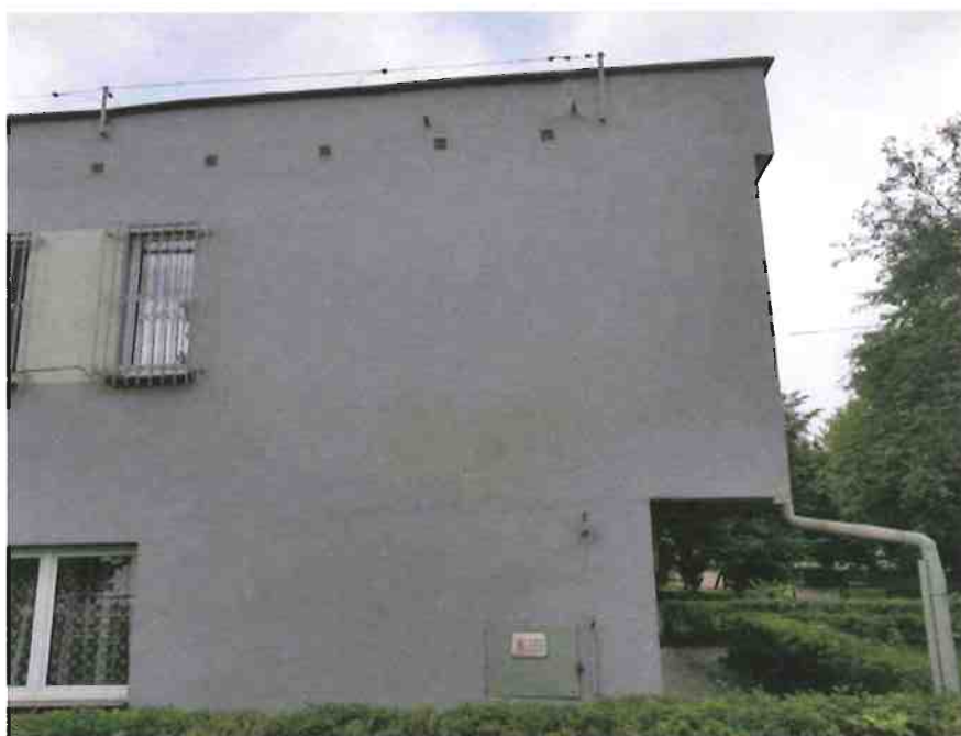
Fot. 3. Ogólny widok elewacji budynku.