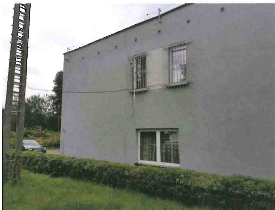
Fot. 4. Ogólny widok elewacji budynku.