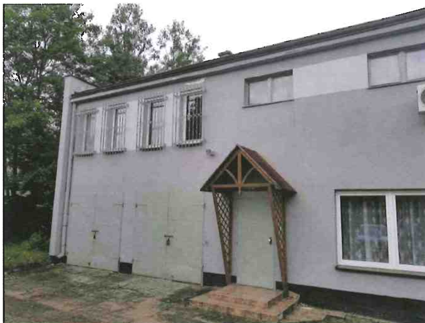
Fot. 2. Ogólny widok elewacji budynku.